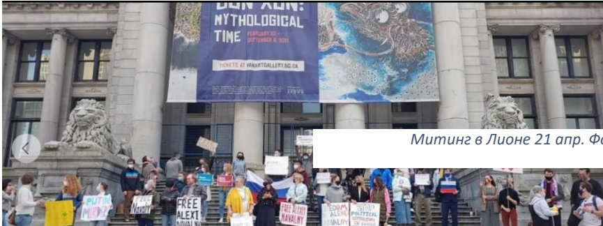
Митинг в Лионе 21 апр.