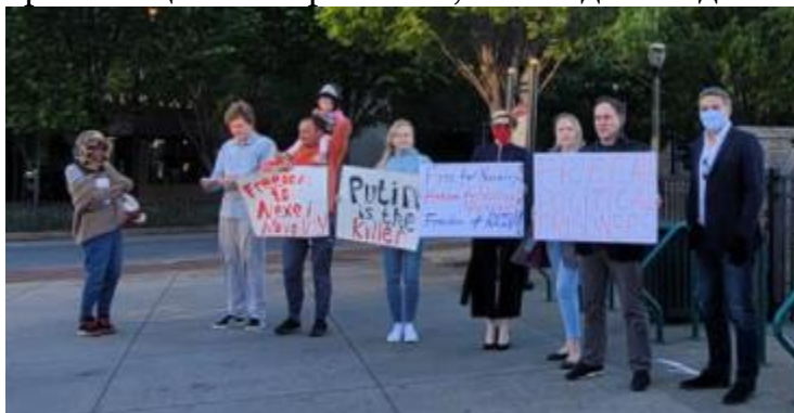
Митинг в Атланте 21 апр.